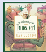
Si seulement j'avais un nez vert